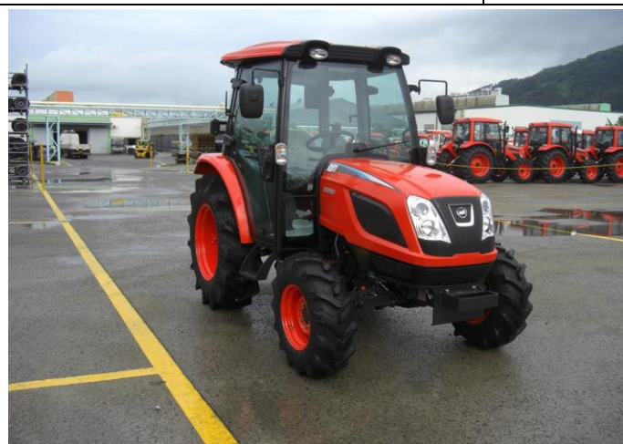
FIȘA TEHNICĂ Tractor Kioti, mod., „Mec”: „ NX5520 si NX5520C ” cu motor Tier 4 / Euro 4: