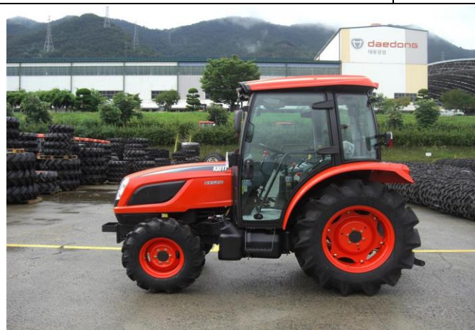
FIȘA TEHNICĂ Tractor KIOTI, model Mecanic: ” NX5020 si NX5020C ”- Euro 3 / Tier3;